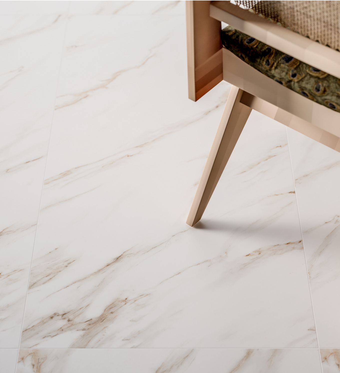
vena bella 60x120 /rektyfikowana/