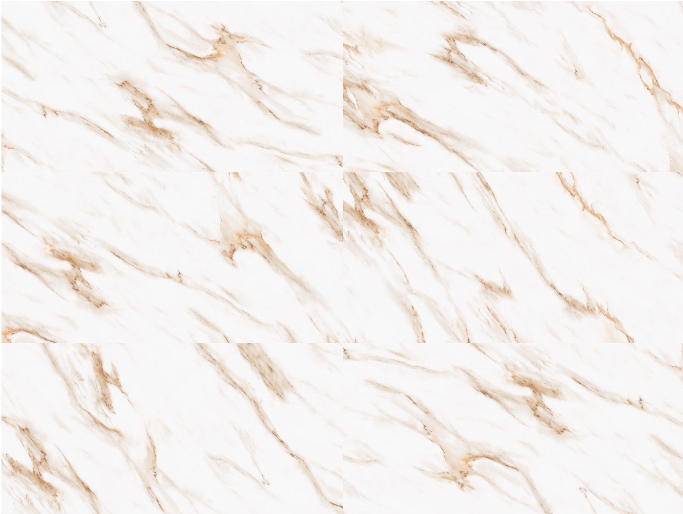
vena bella 60x120 rektyfikowana